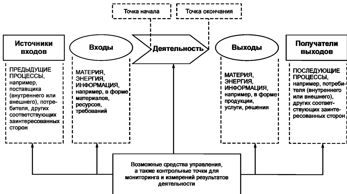
Рисунок 1 — Схематичное изображение элементов процесса

Рисунок 1 дает схематичное изображение любого процесса и иллюстрирует взаимосвязь элементов процесса. Контрольные точки мониторинга и измерения, необходимые для управления, являются специфическими для каждого процесса и будут варьироваться в зависимости от соответствующих рисков.